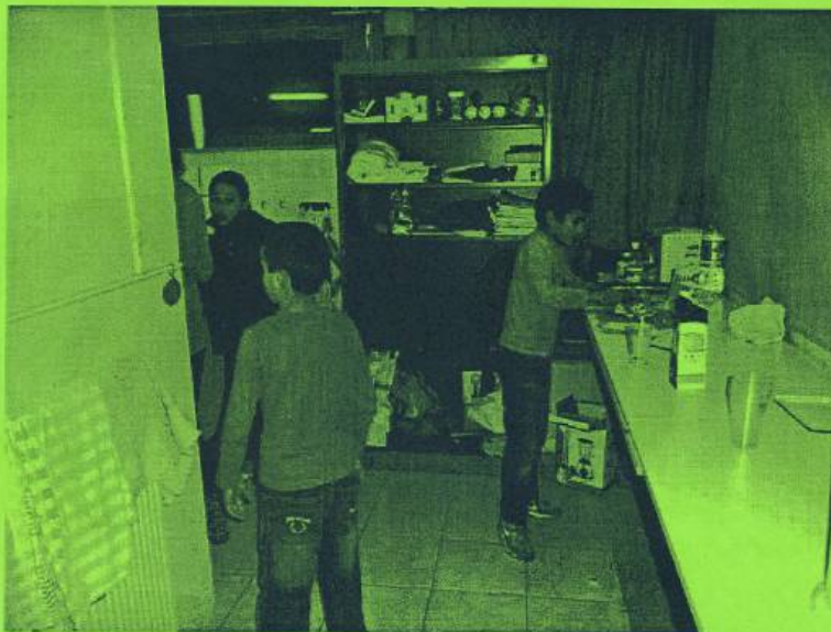
Foto: Jongeren in de Bühne aan de slag voor het maken van milkshakes.

Als u het leuk vindt om een keer langs te komen bij de Bühne voor een kopje thee of koffie of een praatje, dan kan dat altijd. Ook uw kinderen zijn van harte welkom op onze clubs!