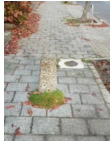
7. Molenmeesterslag, t.h.v. Nummer 41 : curieuze paal op de stoep (foto 7)