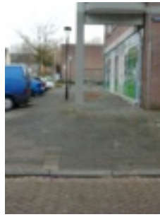
5. Dijkgraafslag van begin tot eind : bobbels en kuilen op de parkeerterreinen (foto 4, 5,)